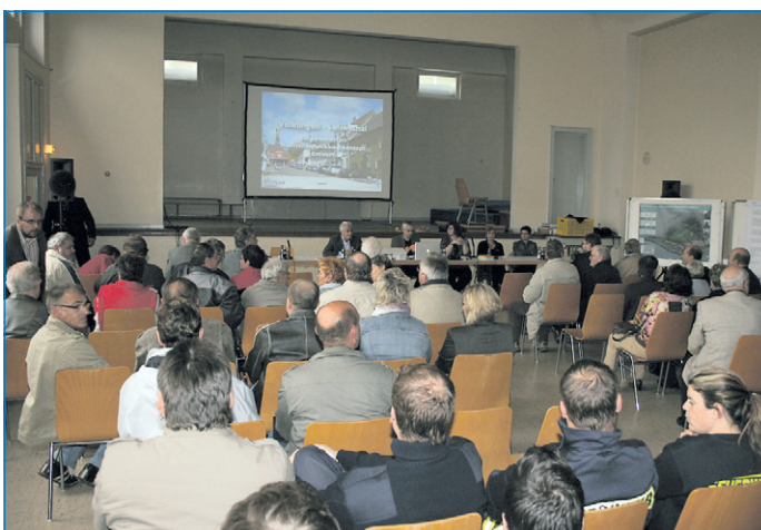
Luisenthaler Bürgerinnen und Bürger zeigten großes Interesse

Städte und Dörfer stehen vor gewaltigen Herausforderungen. Dies trifft insbesondere auch für den Völklinger Stadtteil Luisenthal zu, der neben den klassischen Herausforderungen wie demografischer Wandel und Strukturwandel auch noch die besonderen Herausforderungen einer starken Lärmbelastung und die Folgen der Schließung des Bergwerkes zu tragen hat. Vor diesem Hintergrund hat die Stadtverwaltung die Entwicklung eines Stadtteilentwicklungskonzeptes an das Büro Kernplan, Illingen, in Auftrag gegeben. Nach Vorlage des ersten Entwurfes wurde das Konzept nun in einer öffentlichen Bürgerwerkstatt in Luisenthal vorgestellt. Hierzu hatte Oberbürgermeister Klaus Lorig eingeladen und über siebzig Luisenthaler Bürger und Bürgerinnen nahmen die Einladung an.