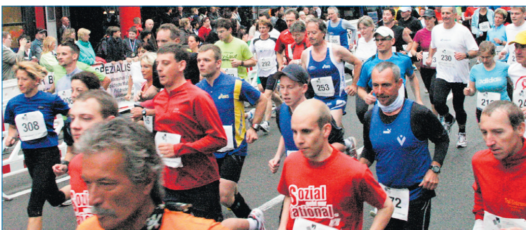
Hundert von Sportbegeisterten werden beim City-Lauf in der Völklinger Innenstadt erwartet