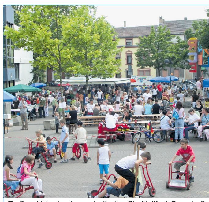
Treffpunkt in der Innenstadt: das Stadtteilstfest Bergstraße

rund vierzig Kinder darf man gespannt sein. Bei „Show- und Breakdance“ kommen auch die größeren Kinder auf ihre Kosten. Das Jugendzentrum Völklingen stellt sich mit „No comment“ vor. Ab 16 Uhr wird es heiß bei Feuershow und Mitmach-Zirkus der Zirkusschule Heckmeck und der Zirkus-AG von der ERS „Am Sonnenhügel“. Der TSC Royal des Turnvereins Völklingen führt Hip-Hop und Breakdance auf und eine Folkloregruppe einen anatolischen Volkstanz. Zum Abschluss wird eine afrikanische Gruppe mit Trommeln den Rhythmus ab etwa 17.30 Uhr bestimmen, bevor um 18 Uhr das Fest zu Ende gehen wird. Erwartet werden auch wie in den vergangenen beiden Jahren zirka tausend Besucherinnen und Besucher.