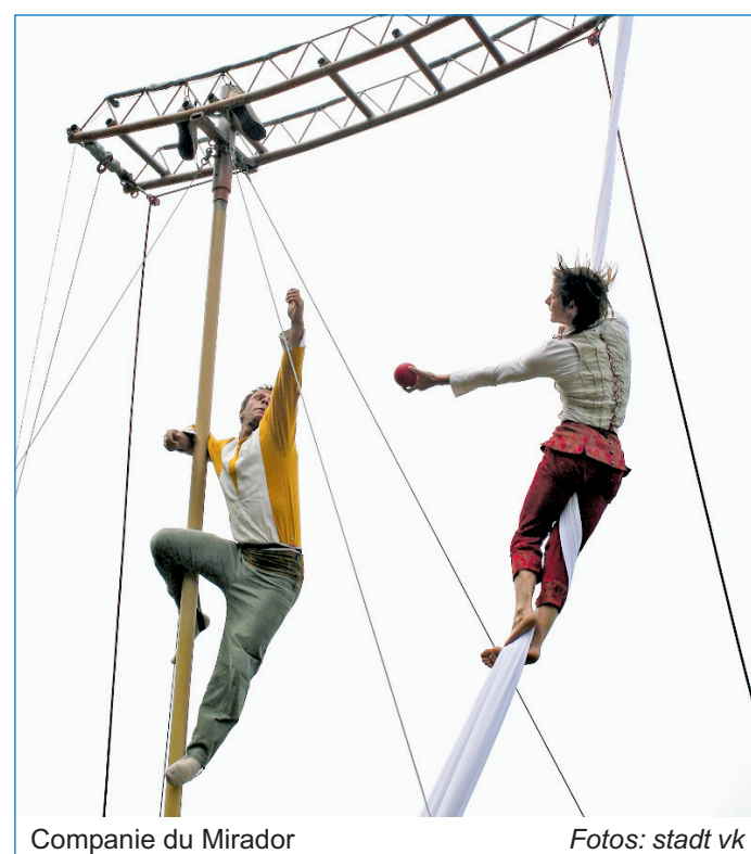
Compagnie du Mirador