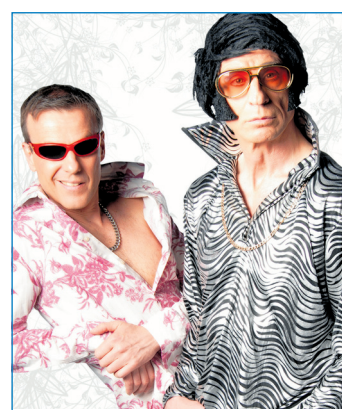
Linne & Riesling

Weiter Informationen finden Interessierte im Internet unter www.sommerszene.de .