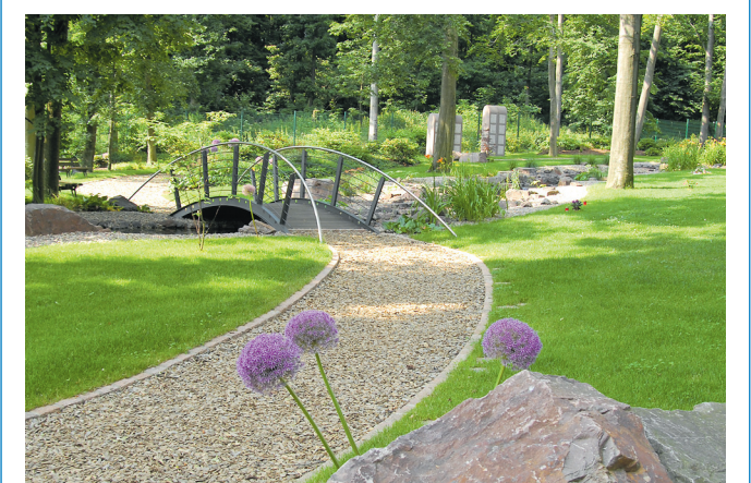
Blick auf den Waldfriedhof

Friedhofswärter – oder unmittelbar der Polizei zu melden. Für Allerheiligen werden in der Zeit vom 24.10.2011 bis 31.10.2011 ab 18 Uhr, und weiterhin für Totensonntag in der Zeit vom 14.11.2011 bis 19.11.2011, die Friedhofstore durch die jeweiligen Friedhofswärter ab 17.30 Uhr geschlossen. Geöffnet werden die Friedhofstore morgens von Montag bis Freitag gegen 7 Uhr. Samstags, sonntags und feiertags werden sie gegen 8 Uhr geöffnet.