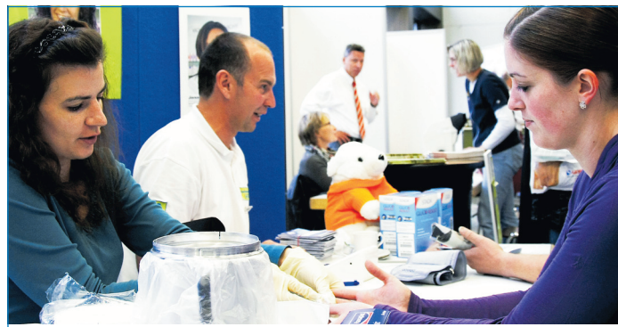
Rathausmitarbeiter ließen sich auch Blutdruck messen.