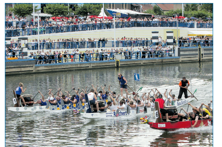
Jährliches Besuchermagnet: die Drachenboot-Meisterschaft in Völklingen

starten im Abstand von 15 Sekunden und kämpfen in einem Rennen über eine Distanz von knapp 2000 Metern und drei Wendemanövern um den begehrten Titel. Ausgetragen werden die Regatten am 27. und 29. Mai 2011. Als Startgebühr wird für die Teilnahme ein Betrag von 120 Euro erhoben, der jedoch die Kosten für eine Trainingseinheit beim Kanuclub Völklingen beinhaltet. Für ein Drachenboot-Team werden 16 Paddlerinnen und Paddler sowie ein/e Trommler/in benötigt; hiervon müssen mindestens sechs Frauen im Boot sitzen. Die Bootsbesatzung kann bis zu zwanzig Personen groß sein. Anmeldeabschluss ist der 7. Mai 2011. Ausführliche Informationen zum Drachenbootsport, dem Rennen und der Ausschreibung können über die Internetseite www.saarfest.de heruntergeladen werden. Anmeldung und Informationen bei der Stadt Völklingen, Veranstaltungsmanagement, Julia Strack, Telefon (06898) 13-23 91.