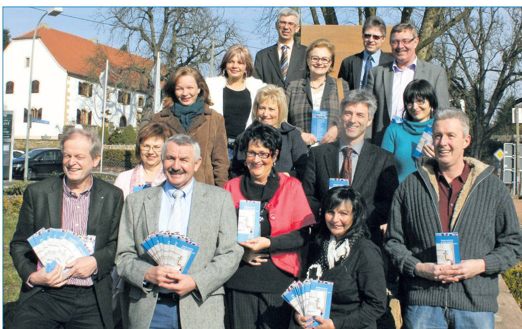
Gemeinsam stark für die Region – Völklingen, Großrosseln und Püttlingen präsentieren die neue Übernachtungsbroschüre

Bintz freute sich, den Anwesenden mitteilen zu können, dass die Zahl der Hotelübernachtungen in Völklingen, verglichen mit dem Vorjahr um runde 11 Prozent gestiegen sei. Damit habe man sogar den positiven Trend im gesamten Regionalverband sowie in der Landeshauptstadt Saarbrücken übertroffen. Das hohe Niveau, das auch die Privatzimmer und Ferienwohnungen bereits