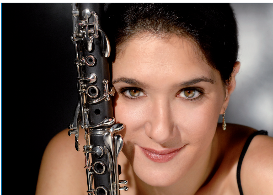
Weltstar Sharon Kam

Vorstellung der Veranstaltungen in den SHG-Kliniken in Völklingen