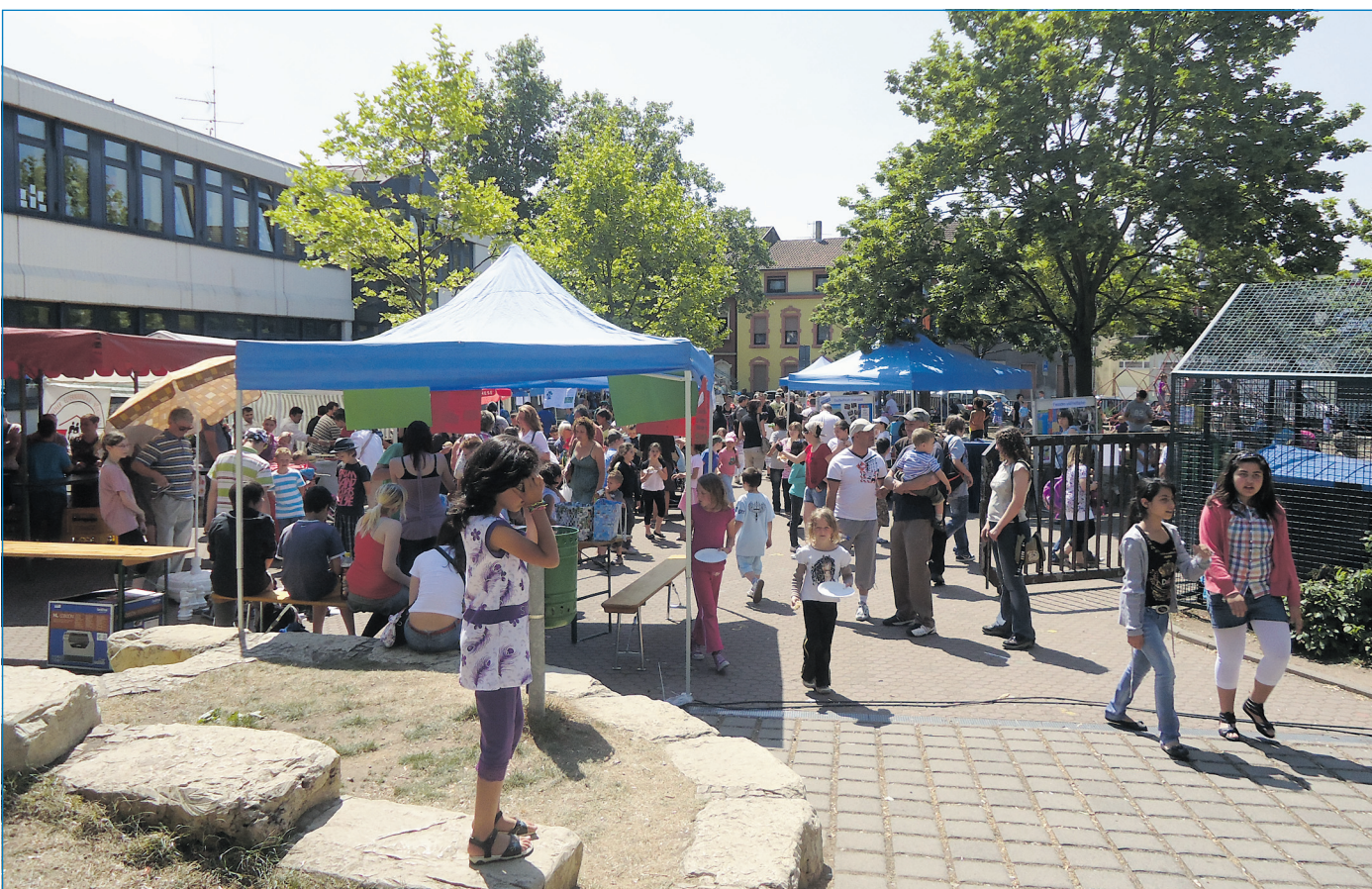
Sorgt immer für viele Zuschauer: das Stadtteilstfest in der Bergstraße

Völklingen informieren als sogenannte „Festlotsen“ über die zahlreichen Attraktionen auf dem Festgelände. Anlass für die Gemeinwesenarbeit Innenstadt schwerpunktmäßig über das neu in der Innenstadt gegründete Netzwerk „Bilden und Lernen im Stadtteil“ zu informieren, ist die Einrichtung der Grundschule Bergstraße / Röchlinghöhe als Modellschule für Inklusion ab dem Schuljahr 2012/13. Das Fest endet wie in den vergangenen Jahren um 18 Uhr.