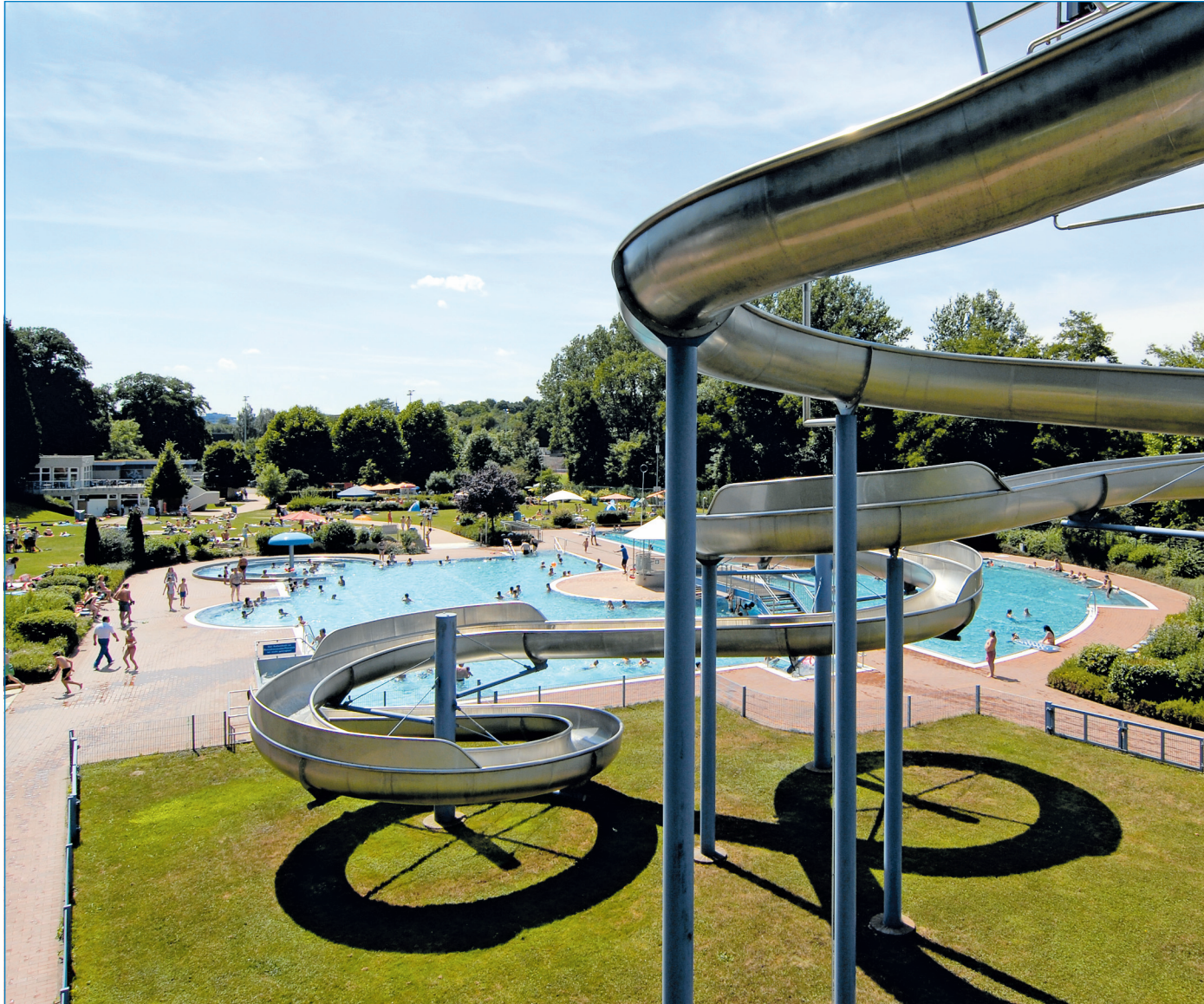
Die attraktive Kulisse des Freibads Völklingen

Für unverlangt eingesandte Artikel übernimmt die Redaktion keine Haftung.