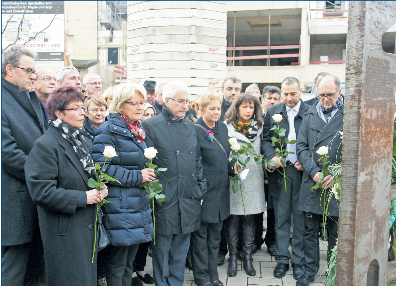
Oberbürgermeister Klaus Lorig und Bürgermeister Wolfgang Bintz mit der Delegation aus der französischen Partnerstadt Forbach (Carmen Harter-Housselle und Marie-Antoinette Gerolt), Vertretern der Muslimischen Verbände, Vertretern des Integrationsbeirats, Mitgliedern des Landtags, Stadtratsvertretern aller Fraktionen, den Völklinger Ortsvorstehern sowie Bürgerinnen und Bürgern bei der Gedenkfeier.

Für unverlangt eingesandte Artikel übernimmt die Redaktion keine Haftung.