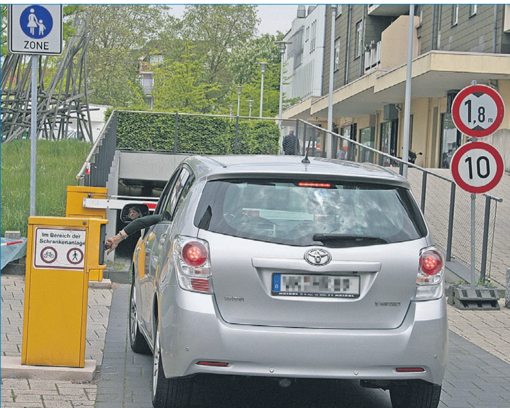
Während der Sanierung ist eine Einfahrt nur noch für Dauerparker über die Einfahrt in der Rathausstraße möglich.

Völklingen, 20.05.2016 Die Ortsvorsteherin gez. Blatt