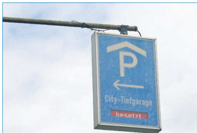
Über der Bismarckstraße wird auf die Sperrung der Tiefgarage hingewiesen.

am 18. Mai 2016 die letzten Bauleistungen beauftragt. Aufgrund der reinen Bauzeit von vier Monaten und den notwendigen Trocknungszeiten kann von einer Wiedereröffnung im Oktober dieses Jahres ausgegangen werden. Die Stellplätze auf der Ebene 1 werden während der Sanierungsarbeiten zudem benutzerfreundlicher gestaltet. Für Nutzer mit Kinderwagen, Rolator oder Rollstuhl werden breitere Parkplätze und sichere Fußwege angelegt. Die Wand-, Boden- und Deckenflächen der Ebenen 1 und 3 werden mit neuen Anstrich- und Leitsystemen beschichtet.