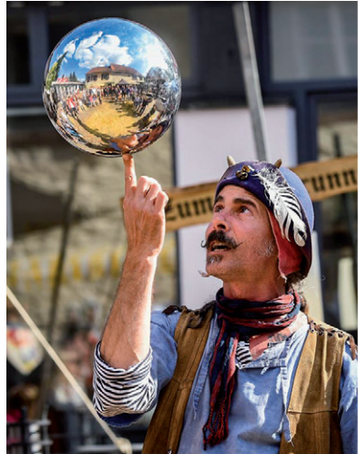
Gaukler Patut

Am Freitag, dem 8. November, können Nachtschwärmer und Familien mit Kindern von 16 Uhr bis