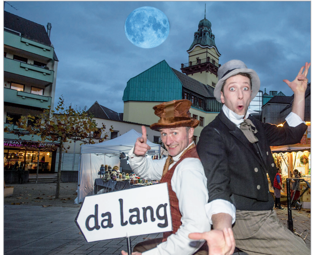
Szenerie vom Mondscheinmarkt 2016

Gaukler Patut die Besucher des Mondschein-Marktes mit Jonglagen, Possenspielen und einigen verblüffenden Zaubertricks.