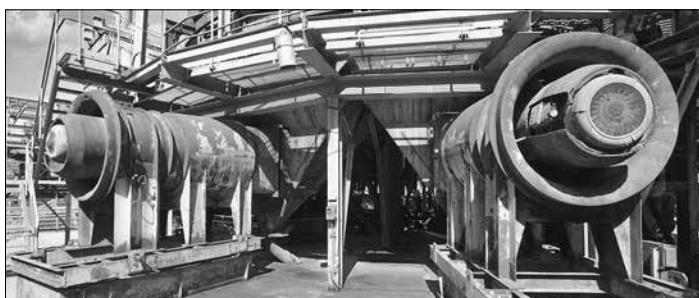
Entdeckerweg über den Sinterrundkühler und die Sinterentstaubung Weltkulturerbe Völklinger Hütte

Der neue Entdeckerweg im Weltkulturerbe Völklinger Hütte führt in luftige Höhen und bietet spektakuläre Ausblicke auf die Hochofengruppe