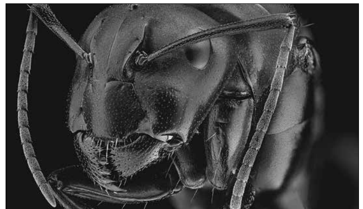
Ameise

Die Saarländische Fotomeisterschaft wird bereits seit Jahrzehnten von jeweils einem Fotoclub im Saarland durchgeführt. Der Fotoclub Völklingen war in den letzten 10 Jahren bereits 3 mal Ausrichter. In diesem Jahr lag die Ausführung jedoch in den Händen des Landesvorstandes des Deutschen Verbandes für Fotografie e.V. Der Wettbewerb wurde digital durchgeführt. Zurzeit wird noch eine Möglichkeit gesucht, die Bilder auszustellen und der Öffentlichkeit zu präsentieren.