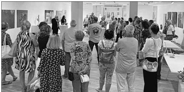
Rund 50 Kunstinteressierte waren zur Eröffnung der Ausstellung „Sichtweisen 2023“ in das Völklinger City-Büro gekommen.

Der Verein „KulturGut e. V. – Verein zur Förderung von Kultur und Kommunikation in Völklingen“ feierte am Donnerstag, den 6. Juli, die erfolgreiche Eröffnung seiner Ausstellung „Sichtweisen 2023“. Rund 50 Kulturräffine folgten dem Lockruf der Kunst und kamen in die Räumlichkeiten des Citymanagements in der Rathausstraße 26 in Völklingen.