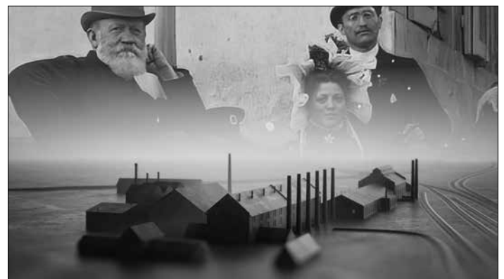
Screenshot aus dem Film BEWEGUNG MACHT GESCHICHTE. Die Völklinger Hütte, 2023

(Kinder bis 14 Jahre nur in Begleitung eines bevollmächtigten Erwachsenen) Studierende, Schüler und Auszubildende bis 27 Jahre: Eintritt frei (mit gültigem Ausweis), Jahreskarte: 55 Euro visit@voelklinger-huette.org | www.voelklinger-huette.org