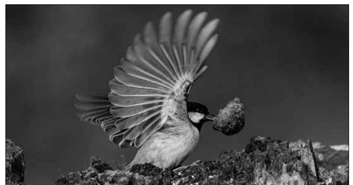
Kohlmeise