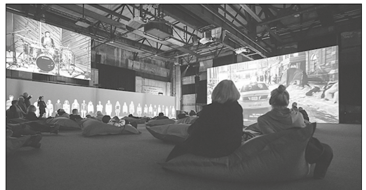
JULIAN ROSEFELDT: WHEN WE ARE GONE, Ausstellungsansicht Die Filminstallation EUPHORIA

Alle Infos zum Sommerferien-Programm finden sich auf www.voelklinger-huette.org