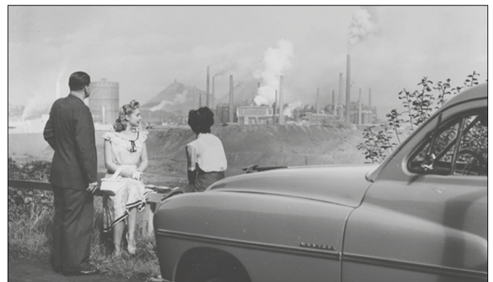
Blick auf die Völklinger Hütte, 1950er Jahre

Als der Hütteningenieur Julius Buch im Frühjahr 1873 die „Völklinger Eisenhütte“ gründete, konnte er nicht ahnen, dass er damit den Grundstein für mehr als 100 Jahre Eisen- und Stahlerzeugung an der Saar legen würde. Am 12. Mai erhielt Julius Buch die Baugenehmigung zur Errichtung der Hütte. Es folgten 150 Jahre voller Höhen und Tiefen, mit zahlreichen Innovationen und wirtschaftlichen Entwicklungsschüben ebenso wie mit Rüstungsproduktion, Zwangsarbeit und Umweltverschmutzung. Im heutigen Weltkulturerbe spiegelt sich auf ganz besondere Weise die Epoche der Hochindustrialisierung, deutsche und europäische Geschichte sowie das Zeitalter des Anthropozäns, in dem der Mensch die Erde massiv gestaltet und verändert hat.