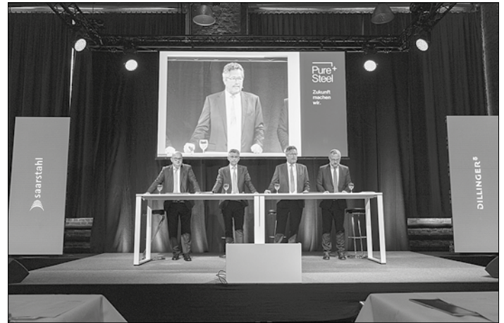
Jahrespressekonferenz Dillinger und Saarstahl