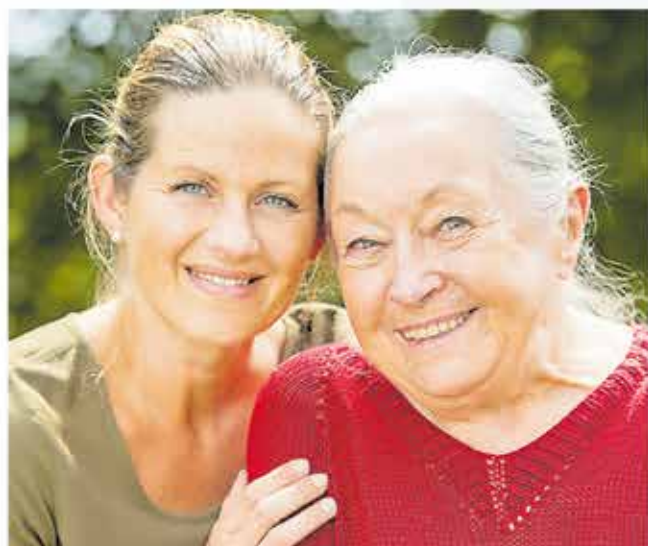
Einsamkeit macht unglücklich. Deshalb gibt es Pflegeherzen.

Hilfe bei der Hauswirtschaft bietet die Seniorenbetreuung Saar – saarlandweit und ohne Warteliste. Sichern Sie sich jetzt Ihren Beratungs-